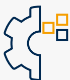
Marketing & Vertrieb

Bilden Sie Ihre Mitarbeitenden auf Hochschulniveau weiter in diesen Themenbereichen: