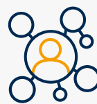
Human Resource Management